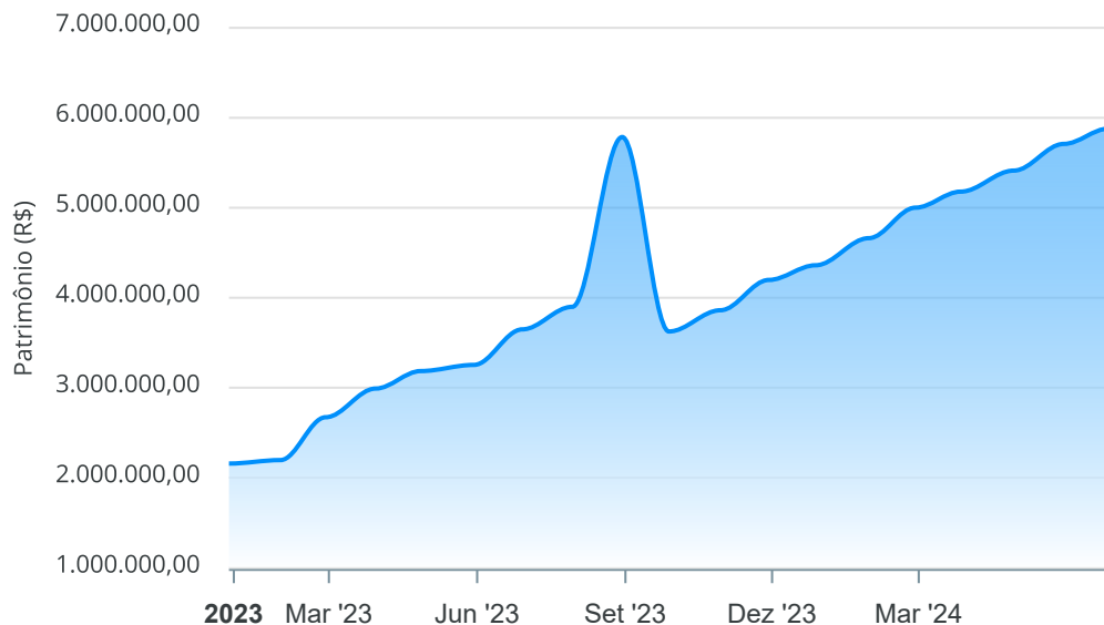
Evolução do Patrimônio